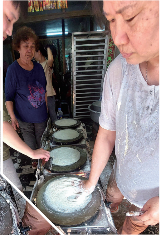
左上 麵糰揉好後需靜置一小時，才會有彈性且不易斷裂(一) 右上 手持麵糰順時針迅速擦過一圈(二) 中 當圓形的皮成形後，手部動作要俐落收回(三) 右下 看到餅皮邊緣稍微翹起，表示要撕下了(四) 左下 用指尖或工具輕巧撕下潤餅皮(五)