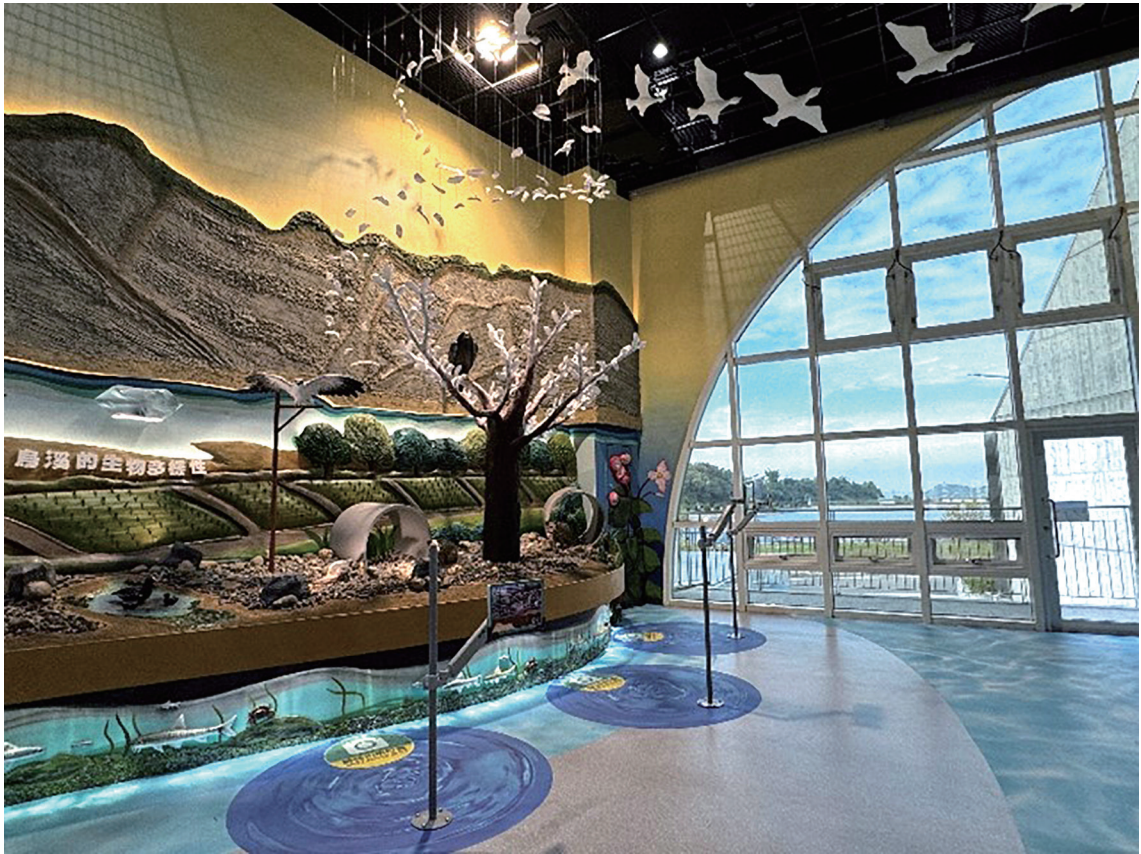
烏溪的生物多樣性展示區