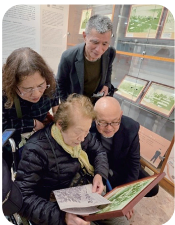
德光重人先生向妙子奶奶一家人介紹烏山頭水庫老照片