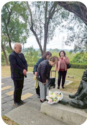
妙子奶奶一家人向八田與一、八田外代樹紀念銅像獻花致意