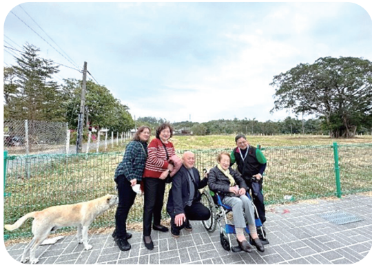
烏山頭職員宿舍略圖，圖中紅色區塊即為湯本技師住處，宿舍現址為空地