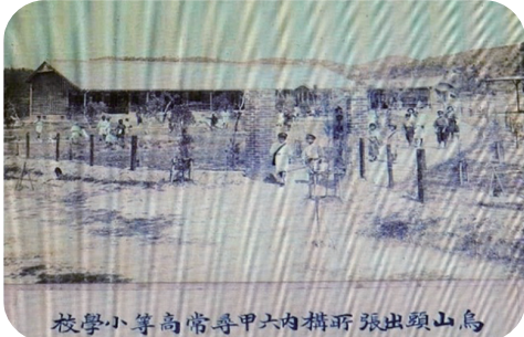
烏山頭出張所內六甲尋常高等小學校