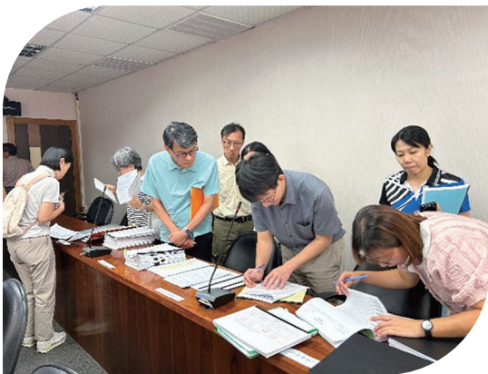
上 114年9月11日辦理七星管理處實地抽查 下 114年9月12日辦理南投管理處實地抽查