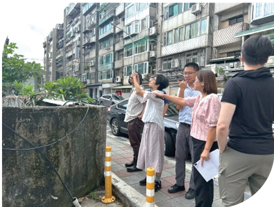
下 114年8月22日辦理嘉南管理處實地抽查