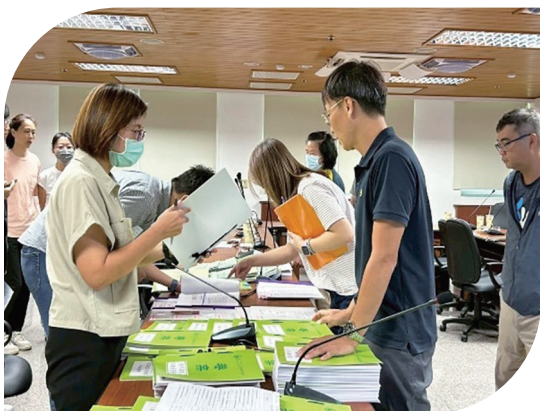
左 114年9月16日辦理宜蘭管理處實地抽查 右 114年9月19日辦理苗栗管理處實地抽查