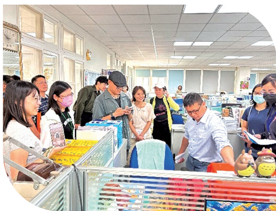
上 114年8月14日辦理高雄管理處實地抽查