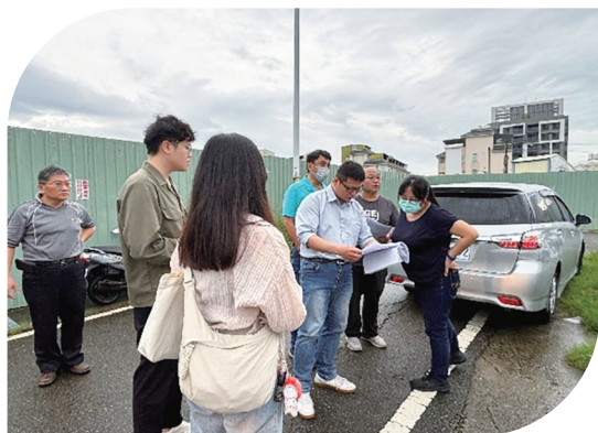
上 114年7月8日辦理新竹管理處實地抽查 下 114年7月11日辦理彰化管理處實地抽查