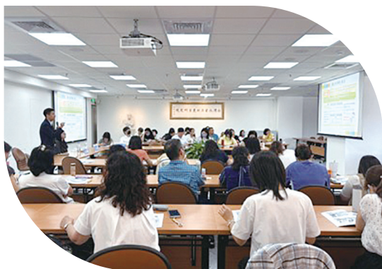
上 114年5月26日辦理公務車輛增購或汰購法規及實務教育訓練 下 114年10月15日辦理出納所得稅法規教育訓練