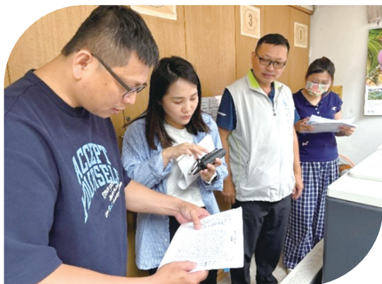
下 114年8月6日辦理瑠公管理處實地抽查