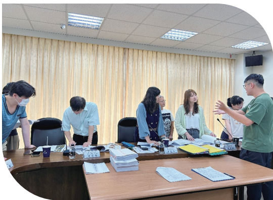
上 114年8月5日辦理北基管理處實地抽查