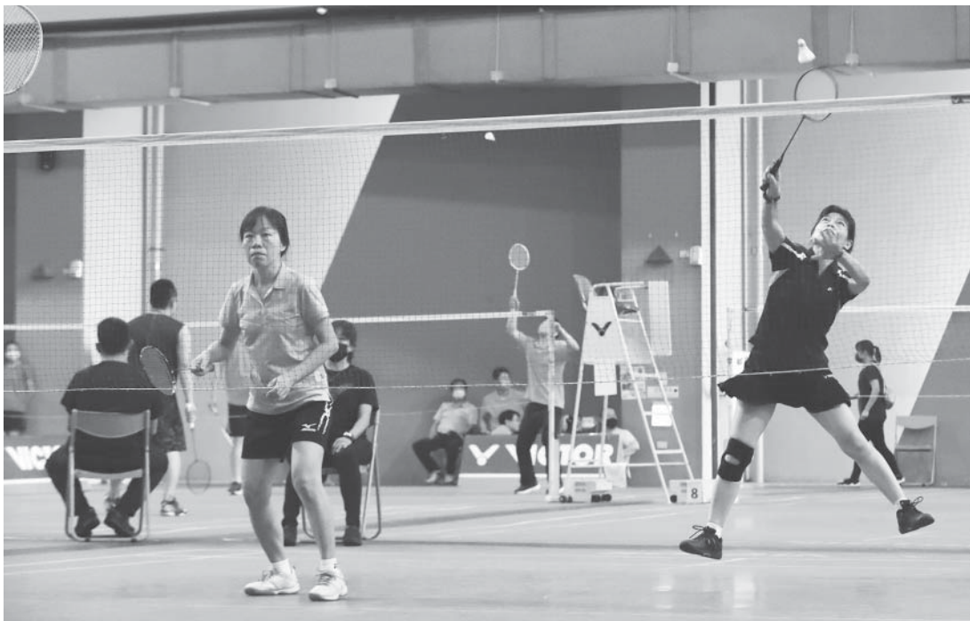
女子組球員成“大”字型的回球妙姿