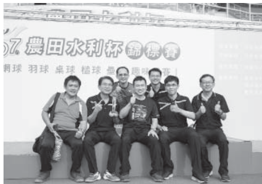
男羽冠軍隊嘉南管理處