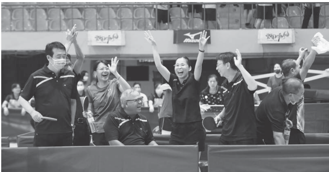
嘉南管理處奪冠後，選手休息區欣喜若狂