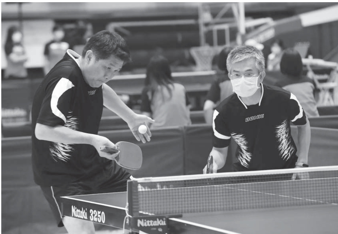
桃園A選手接球有如跳舞

揮家，古有順前面被幌得有點不太習慣，一度被0：7遠遠超前，後來習慣球路才慢慢追趕，但最後仍不敵邱站