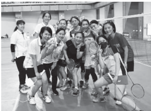
女羽冠軍石門隊（右）與農水署選手合影