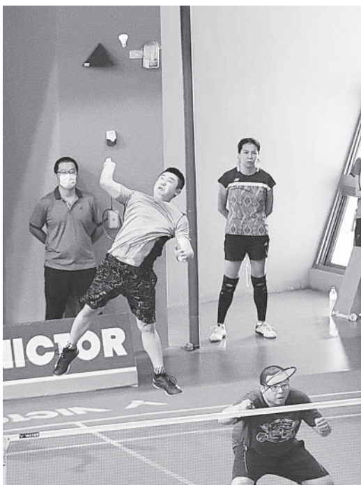
男子組還有選手可以躍起躍殺，對一般球友來說是高難度動作

今年男羽不再分甲乙組，男子組共15隊參賽，五個分組的第一名球隊進行抽籤占柱，嘉南被分在A柱，等B、C柱的桃園和南投兩隊廝殺後以逸待勞，結果是桃園出線，嘉南旋即以3：0完封，站上冠亞軍賽，遭遇另一柱上來的彰化，再以3：0退敵，從初賽至決賽四場球都是直落三收拾對手，以秋風掃落葉之姿奪冠，第二名是彰化、第三名桃園。