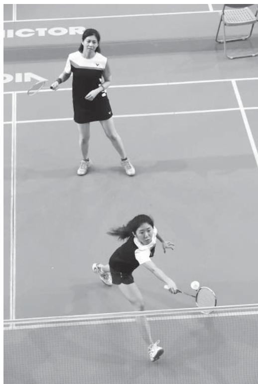
嘉南女羽自稱顏值冠軍